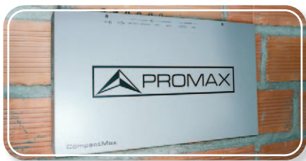
▲ MONTAGE MURAL OU RACK 19" ▲

CompactMax-1 est un système compact qui permet de transmoduler des chaînes satellite (DVB-S ou DVB-S2) au format de la TNT (DVB-T). Il permet de traiter un maximum de 4 entrées satellite (2 pour chaînes en clair et 2 pour chaînes cryptées) et jusqu'à 8 multiplex DVB-T en sortie, qui peuvent être gérées à distance de façon dynamique à travers du webserver intégré. Tout cela intégré dans un module 1U pour montage dans armoire rack 19" standard, mais préparé aussi être fixé directement au mur.